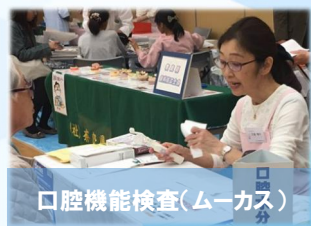
口腔機能検査(ムース)