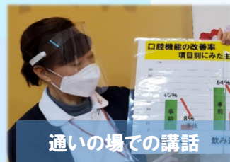
通いの場での講話