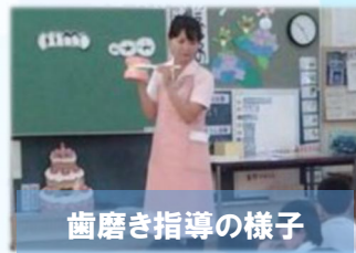
歯磨き指導の様子