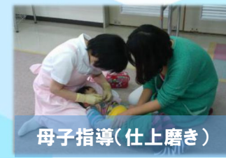
母子指導(仕上げ磨き)